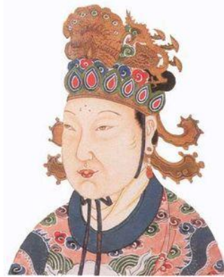
Emperatriz Wu Zetian

De acuerdo a la tradición, el sutra se tradujo por Paramiti y por varios Bhikshus indios en el año 705, en el Monasterio Chih Chih , en Cantón, China; y después se pulió y editó por el ministro Fang Yung de la Emperatriz Wu Zetian.