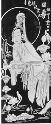
Kwannon – Kuan-Yin

16. La erudición no es de mucho provecho en el estudio del budismo, como lo demuestra el caso de Ānanda que, seducido por el encanto mágico de una cortesana, estuvo a punto de cometer una de las más graves transgresiones. En la práctica del Samadhī es muy necesario el control de la mente, lo cual es Sila (precepto moral). El Sila consiste en deshacerse del impulso sexual, del impulso de matar a los seres vivientes, del impulso de tomar cosas que no pertenecen a uno, y del deseo de comer carne. Cuando estos impulsos se mantienen triunfalmente bajo restricción, se puede practicar realmente la meditación desde la cual crece el Prajna; y es el Prajna el que conduce hacia la Esencia cuando se experimenta la ínter-fusión perfecta de todos los seis Vijnanas.