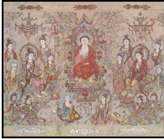
El Buda Shakyamuni enseñando