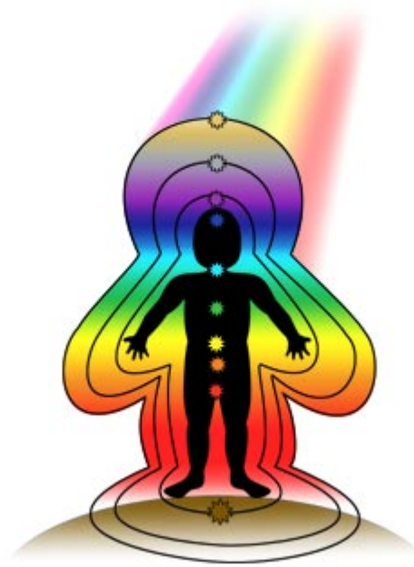
Diagrama de los auras