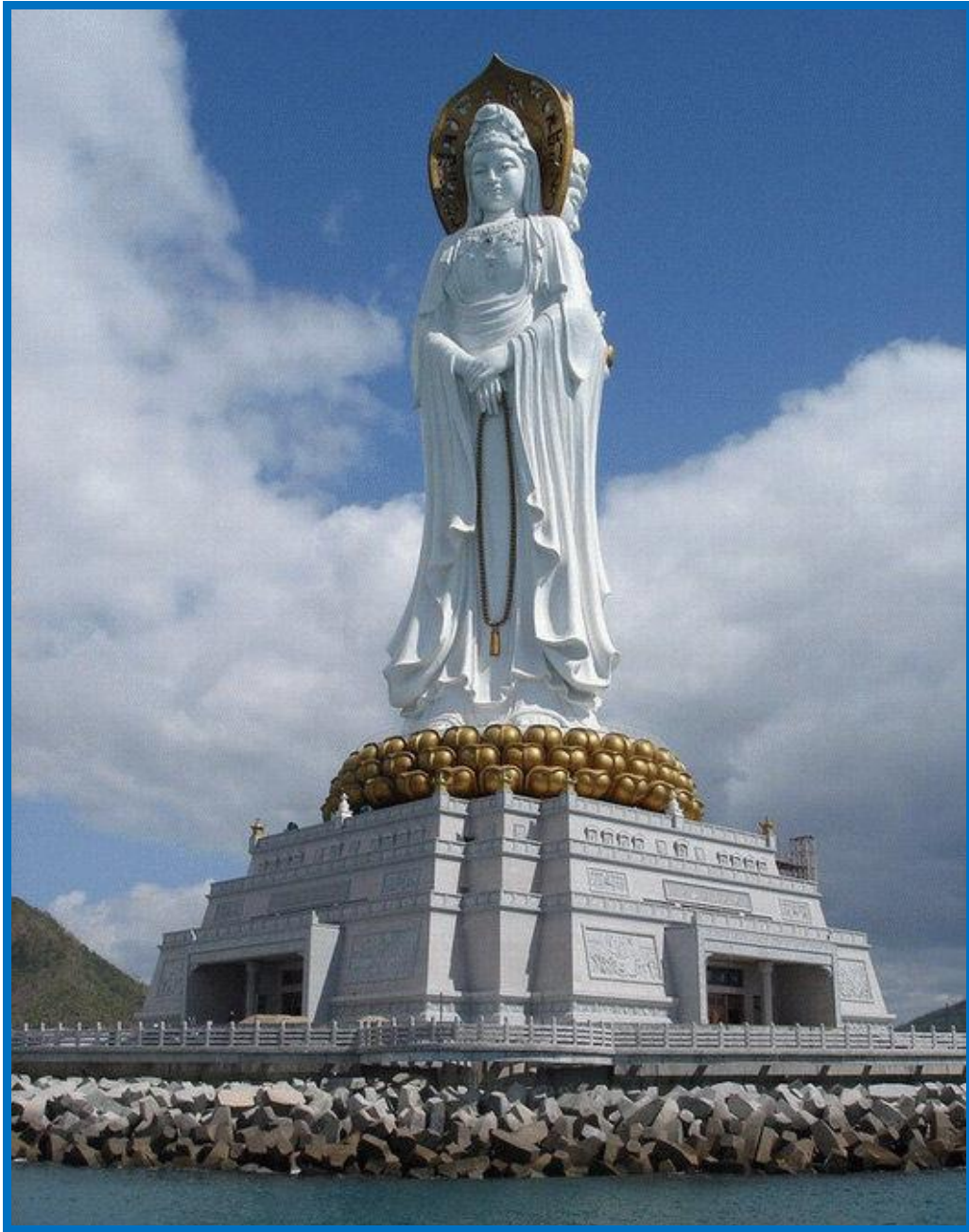
Bodhisattva Kwan Shi Yin (Kwan Se Um, Avalokitesvara)